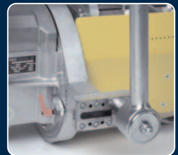
Kardanaufhängung mit Feststellmöglichkeit und einstellbarem Schwerpunkt