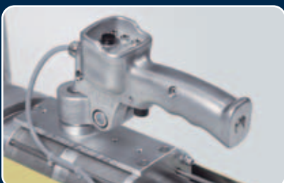
Handgriff ist in verschiedene Positionen schwenk- und einstellbar