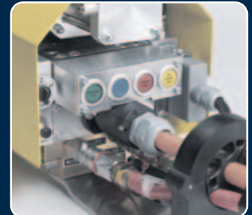
Alle Anschlußmedien steckbar ausgeführt