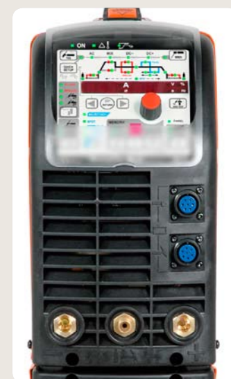
Alle Schweißgeräte der Reihe „MasterTig MLS ACDC“ können mit einem ACX- oder ACS-Bedienpanel ausgestattet werden, an denen zahlreiche nützliche Funktionen für eine angenehmere und effizientere Schweißarbeit ausgeführt werden können.

Speicherkanäle und Sonderfunktionen wie MicroTack, Impulsschweißen, Minilog, 4T LOG