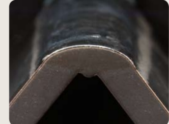
Ein stabiler Lichtbogen sorgt für eine gleichförmige Schweißnaht und ein festes Aneinanderfügen der geschweißten Teile, wodurch wiederum gute mechanische Eigenschaften der Schweißverbindung gewährleistet wird.

Ein größerer Anteil an Wechselstrom führt zu einem besseren Reinigungseffekt, während ein höherer Gleichstrom einen besseren Einbrand gewährleistet.