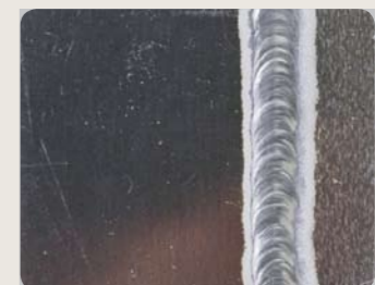
Mit Hilfe der Funktion MIX TIG können die guten Qualitäten von Gleich- und Wechselstrom kombiniert werden. Sie erleichtert das Verschweißen von Aluminiummaterialien und gewährleistet eine Minimierung der Anzahl von Verformungen.