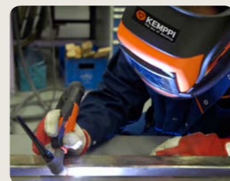
Schweißen mit der Funktion MicroTack führt auf einfache und schnelle Weise zu einer besseren Qualität und Produktivität der Schweißarbeit.